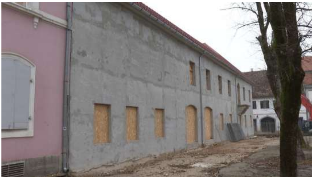
Slika 8. Zgrada KA-mod

Zgrada KA-moda je, na temelju inicijative provedene nezavisno od Muzeja grada Karlovca bila namijenjena galerijskom sadržaju odnosno postavu fondacije Josip Vaništa, uz angažman Ministarstva kulture i medija, te je kao takva projektirana od strane A.C.M. Nakon što se ovaj plan izjalovio počeli su dogovori o zajedničkom korištenju prostora od strane Konzervatorskog odjela (uredski) i Muzeja grada Karlovca, u prizemlju gotovo u potpunosti otvorenog režima. Projekt kojeg je za potrebe Muzeja prilagodila ista projektantska tvrtka nastao je u listopadu 2023. S obzirom na način financiranja (sredstva EU) raspodjela prostora morala bi ostati nepromijenjena najmanje narednih 5 godina. U tijeku je otklanjanje posljedica nedavnog puknuća zgrade nastalog prilikom podzemnih radova na infrastrukturi. U tijeku je prijenos vlasništva sa Republike Hrvatske na grad Karlovac.