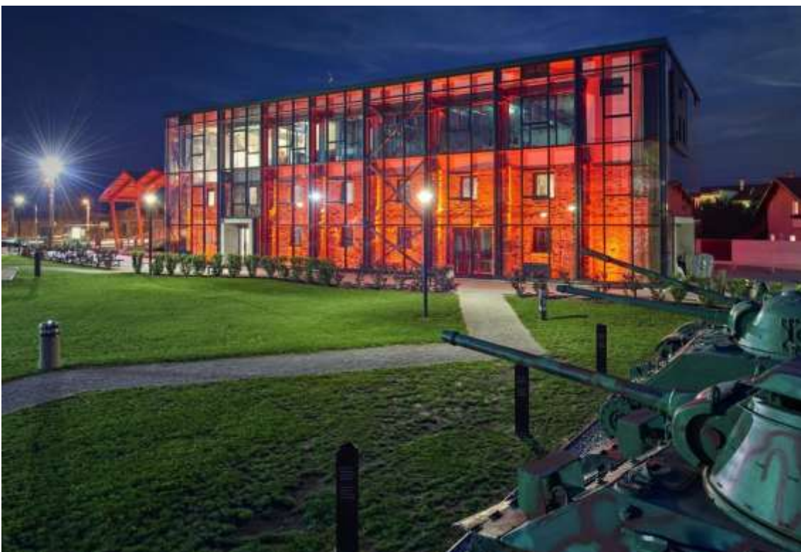
Slika 6. Muzej Domovinskog rata Karlovac – Turanj

Muzej je usmjeren na potvrđivanje i obogaćivanje kulturnog identiteta zajednice, aktivno sudjelovanje u kulturnom životu grada i podupiranje multidisciplinarnе suradnje. Stalna izložba i programi Muzeja Domovinskog rata Karlovac – Turanj promiču temeljne vrijednosti Domovinskog rata, ideju domoljublja i humanizma. Godine 2021. Muzeju je u okviru 6. Međunarodnog kongresa povijesnih gradova odlukom stručnog žirija dodijeljena međunarodna kulturno-turistička nagrada „Plautilla“, a u 2020. bio je nominiran za Nagradu za europski muzej godine 2021. Europskog muzejskog foruma.