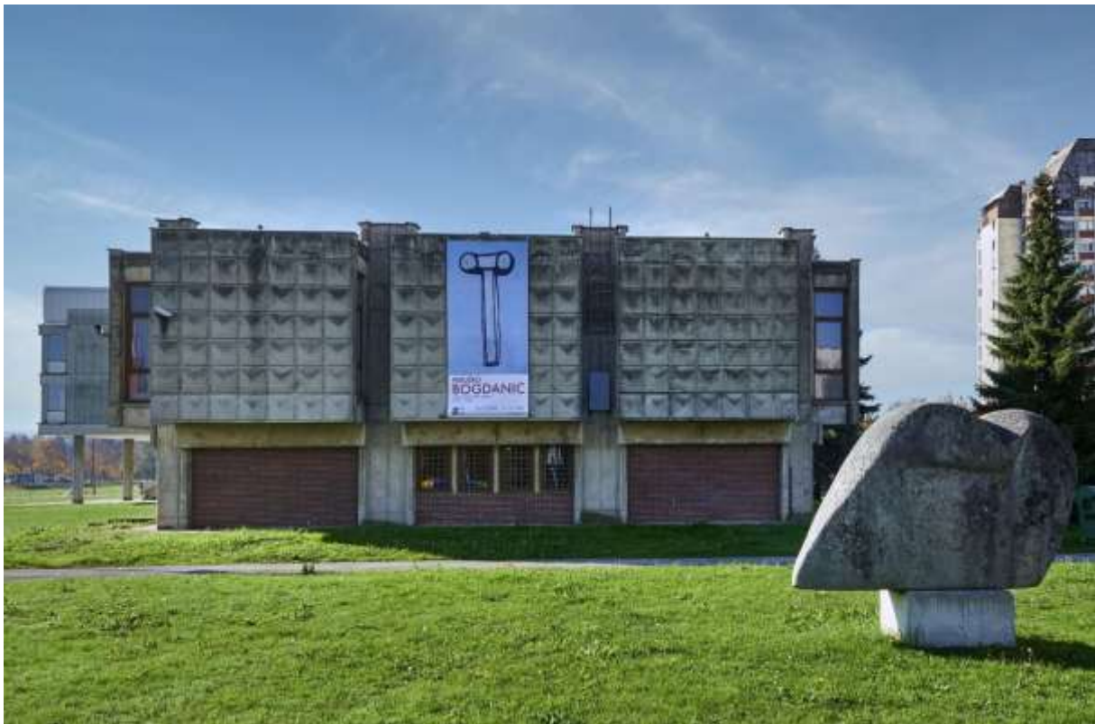
Slika 3. Galerija „Vjekoslav Karas”

nacionalnom kontekstu. Prostor se rjeđe se koristi i za muzejske izložbe drugih odjela karlovačkog Muzeja. Muzej odnosno Galerija je organizator nacionalnog trijenala akvarela.