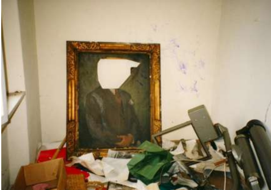
Slika 7. Memorijalna kuća obitelji Ribar, Portret kojem je izrezana glava