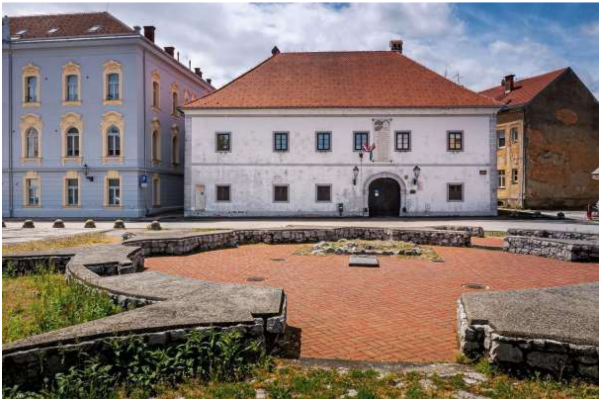
Slika 1. Gradski muzej Karlovac

Ako se kao referentna vrijednost uzme prijašnji stalni postav koji datira iz 1990. godine, prema projektu iz 2023. godine, 432,04 m 2 predviđeno je za prostor otvorenog režima, uključujući izložbeni sadržaj. Stalni postav proširen je sa 263,38 m 2 na 382,41 m 2 , čime je ukupna izložbena površina povećana za 119,09 m 2 , odnosno 31%.