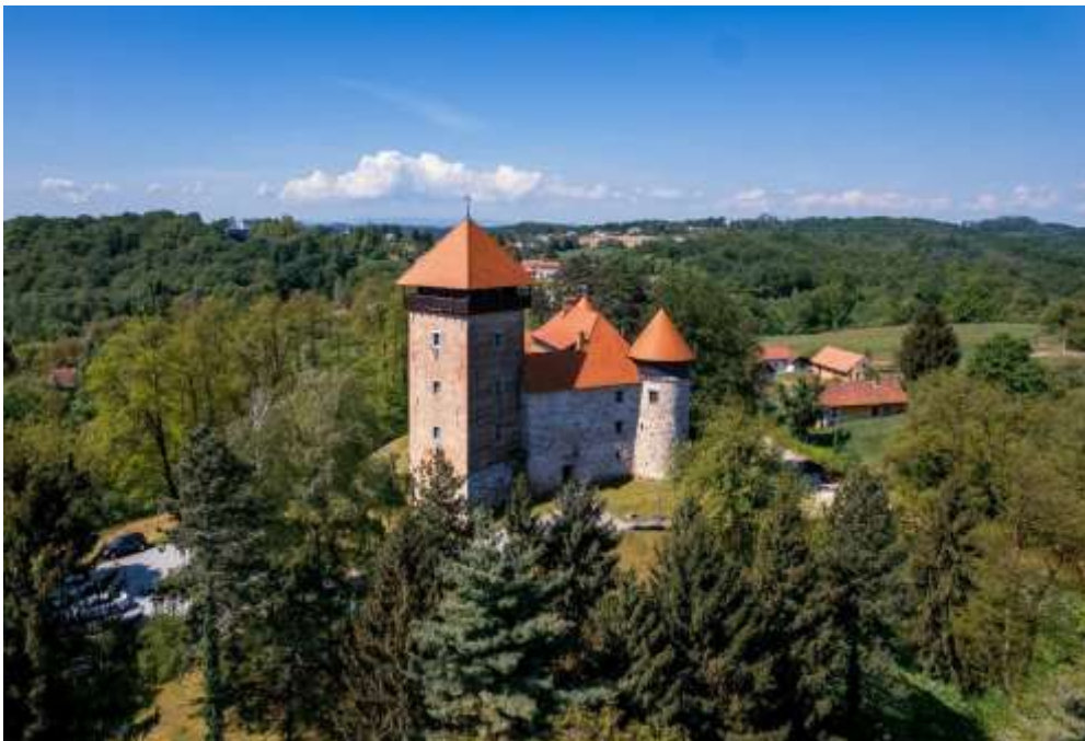
Slika 5. Stari grad Dubovac

Dubovački kaštel zadržao je oblik koji je dobio u kampanji utvrđivanja koja je uslijedila duž pograničnog područja potkraj 15. stoljeća. Četvrtasta branič-kula za dva kata nadvisuje tri oble, dvokatne kule među kojima su razvijena krila s obrambenim, skladišnim i stambenim prostorijama. Međašem u graditeljskoj povijesti može se smatrati 1511. kada tadašnji vlasnik, Bernardin Frankopan, u jednom svojem pismu spominje da je Dubovac od pretežno drvenog postao kameno zdanje.